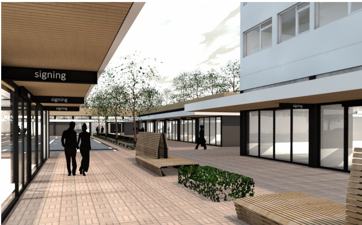
25 APRIL 2016