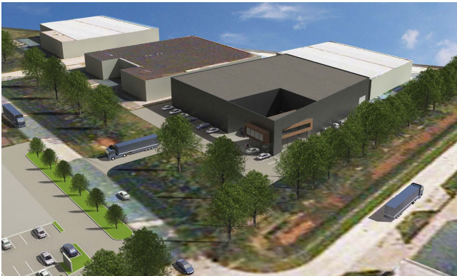
Plan Castor/Hectorsstraat - luchtfoto ingezoomd