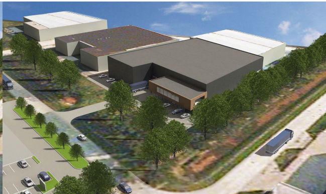
Plan Castor/Hectorsstraat - luchtfoto iso hoek